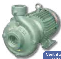
Centrifugas media y alta presión