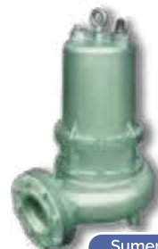
Sumergibles para lodos