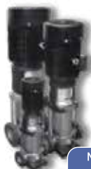
Multi Etapas Verticales