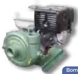
Bomba con motor de combustión