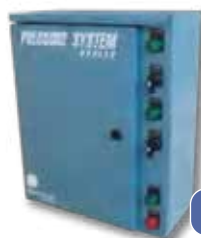
Tableros de control