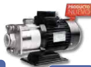
Multi Etapas Horizontales