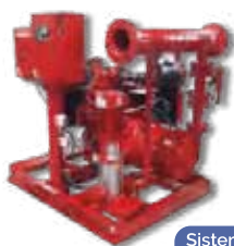
Sistemas contra incendio